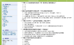
直覺式的測驗功能