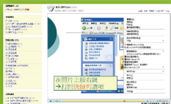
結合PowerCam / EverCam 教材