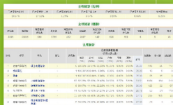
詳細的系統報表資料