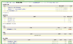
▲ 學生學習記錄查詢

管理者可以透過系統管理功能，了解目前在平台上開課的情況，包含：全校與各單位課程數、教材數、作業數、問卷數、測驗數、討論筆數、教材上網率、...等，輕鬆掌握全校使用狀況。