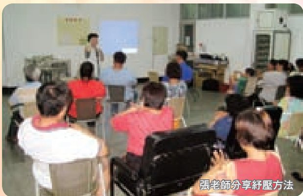
張老師分享紓壓方法

走過八八風災傷痛的兩個月以來，各界投入救災的資源至今仍未停歇，大家有錢出錢、有力出力，總想為災民們做些什麼。高雄「張老師」中心在這次的救災行動中，除了將1980輔導專線的服務時段調整為08:30~22:00，還積極地深入災區，不僅曾在甲仙龍鳳寺、旗山