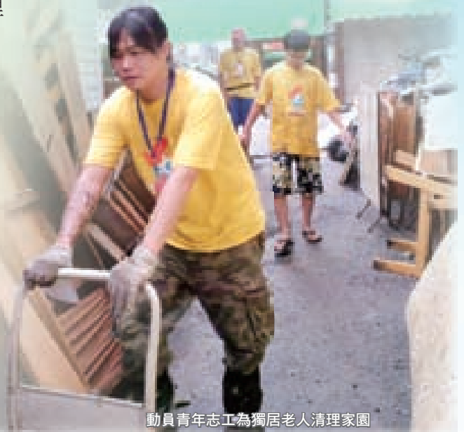
動員青年志工為獨居老人清理家園

當淤泥清的差不多時卻發現停水，居民們抱怨不知道該如何是好。過了一會兒下起午後雷陣雨，志工們看到下雨都樂了起來，拿著臉盆跑到屋外，興奮地說：