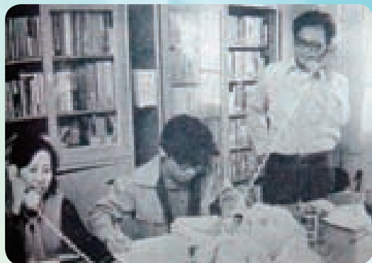
生命線電話接聽——生命線成立民國59年早期沒有所謂的接聽心理電話機構就只有生命線協會，當時生命線在大高雄是受到非常高度的肯定

採訪的過程中認識很多志工單位的承辦人、志工爺爺以及奶奶，每當他們說起早期當志工的心路歷程時可說是沾沾自喜，而採訪中常常聽到大多數的爺爺奶奶都會說的口頭禪：想當初我年輕時當志工的時候做了什麼多麼厲害的事，是不是很可愛的志工爺爺奶奶呢，當我再拿起早期她們年輕時服務的照片，爺爺奶奶都感動到快流眼淚了，我想可能是以前做義工心想做就對了也沒有想說留什麼做回憶，『歡喜做甘願受』志願服務無私的愛阿。