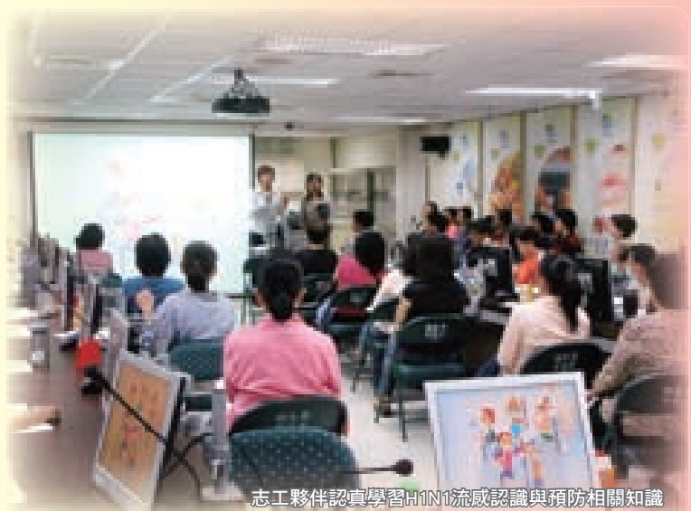
志工夥伴認真學習H1N1流感認識與預防相關知識

朋友們！我們當下舞動自己的身軀吧，讓健康永遠伴隨璀璨多彩的生命。「充實自我，成就他人」。衛生局保健志工團隊 祝福您！