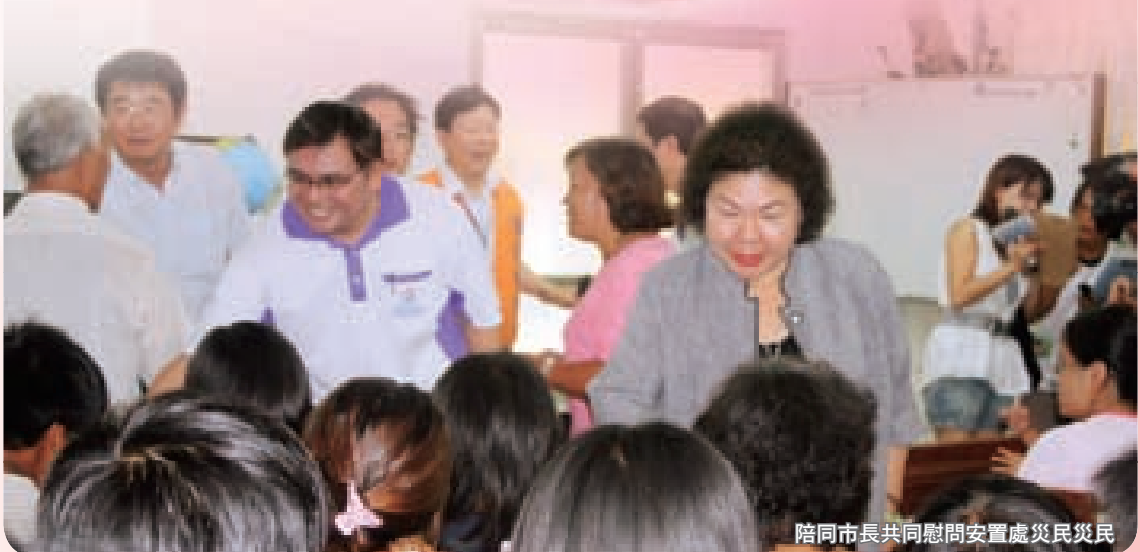
陪同市長共同慰問安置處災民災民

原民會在「88風災」時，聞聲救苦，走在媒體前面，使志工發揮愛心，讓災民感恩於心，而俄鄧·殷艾主委和災民站在一起，適時伸出援手，積極救災整合與管理，使救災行動發揮最大效力。