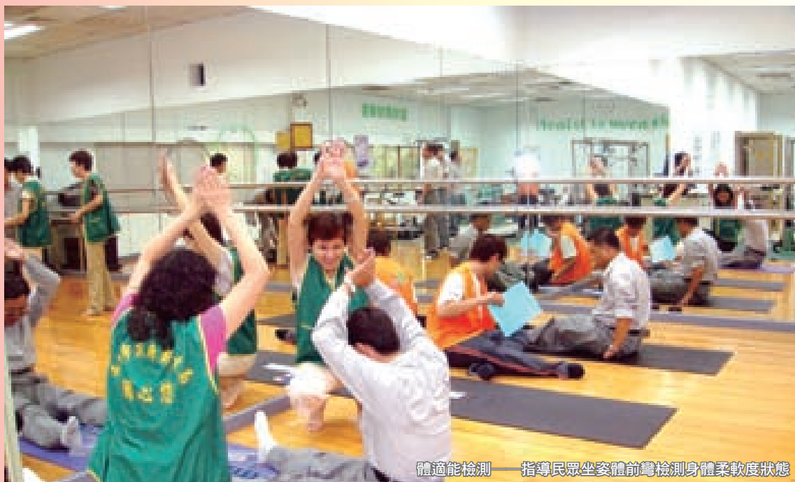
體適能檢測——指導民眾坐姿體前彎檢測身體柔軟度狀態