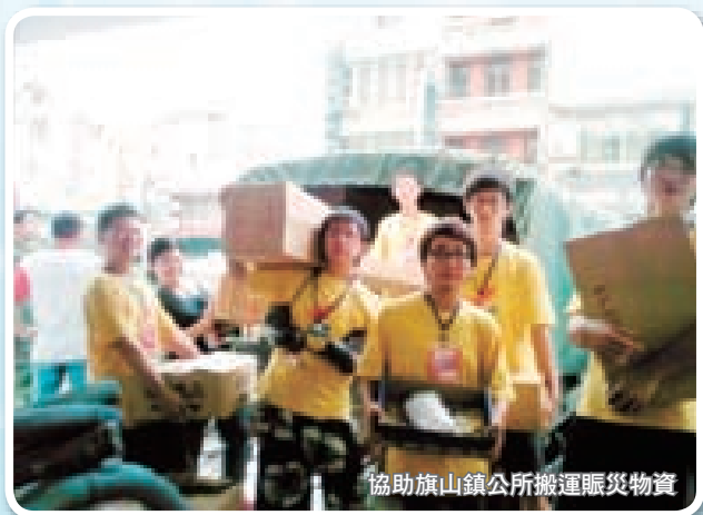
協助旗山鎮公所搬運賑災物資

「有這些雨水就可以幫阿婆家裡弄乾淨啦。」，接著把臉盆擺在屋簷下、排水管口，一盆盆的把雨水往裡面接，有人潑水有人掃水，過了30分鐘雨停了，居民們跟阿婆說：「還好有這群少年ㄟ，把你家弄得比水災前還要乾淨」。阿婆也笑了，開始指導志工們家具的擺放位置，大夥開她玩笑說好像個女指揮官。街坊鄰居拿出吐司、茶水、冰棒感謝志工們協助，歐吉桑歐巴桑們說：「卡早攏覺得大學生只會玩電腦沒想到也能有這麼大的愛心、做這麼多的事，台灣有希望了」。