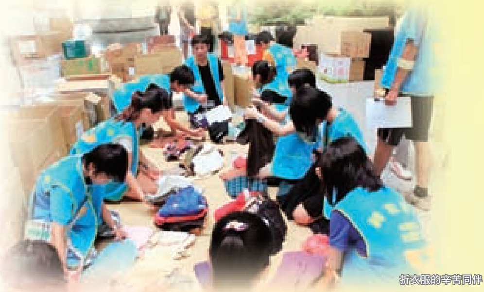
折衣服的苦勞同伴

從八月十一日到整個救災工作結束約兩個星期的時間，她們在市府前廣場借了兩張桌子架設起電腦、電話，就進行支援與調配全局的工作，每日接聽各地災情回報的電話，再經由PTT網站發布災區所需求的物資和人力的消息，也經由