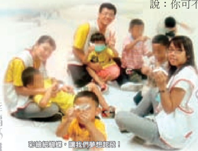
彩繪紙蝴蝶，讓我們夢想起飛！

或許孩子們希望有個人陪吧！孩子們依依不捨的在教會門口說什麼也不願意進去，一直要我們答應他們還要再來，承諾他們會再看到我們，但……孩子們將要被安置到許多地方，接下來希望還能有更多志工能為這些孩子們做長期的陪伴、盡一份心力，讓孩子們能在一個充滿愛與關懷的環境下順利學習、成長。