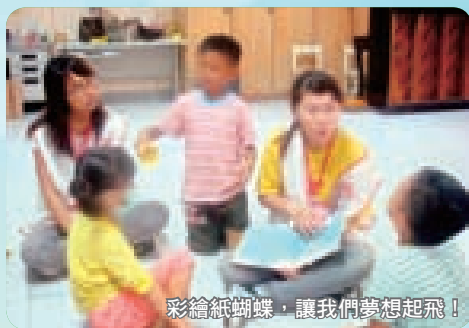
彩繪紙蝴蝶，讓我們夢想起飛！

第一天是到旗山為孩子們帶來魔術及巧手DIY，看到山區的小朋友那麼天真活潑，就想花更多時間陪伴這些孩子們，但也有許多孩子的突發反應讓我們措手不及。有了第一次的經驗，第二次要到草衙時就做了更多的準備，針對不同年齡層做活動安排。