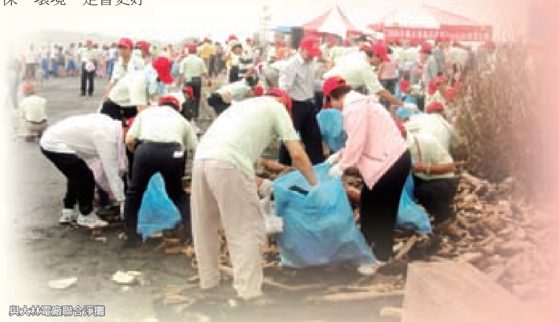
與大林電廠聯合淨灘

在大環境的資源愈來愈少的時代，我們如何善用資源，進而改善環境的品質，下一代的教育刻不容緩，唯有傳承，才能將環保工作做得更好。也希望有更多的人士能加入環保工作，使高雄市更美麗，居住環境更乾淨，大家一起來做環保，環境一定會更好。