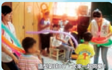
造型氣球DIY，大家一起同樂！

在八月八日台灣發生了一場自我有記憶以來最嚴重的風災，南台灣許多地方嚴重受創，身為南台灣的一份子，多麼希望能盡一份心力，為大家做些什麼；當我得知服務與學習發展協會將與兒福聯盟一起進入災區陪伴孩子們時。我當然非常用心的在做事前準備，希望給孩子們一個特別的午後。