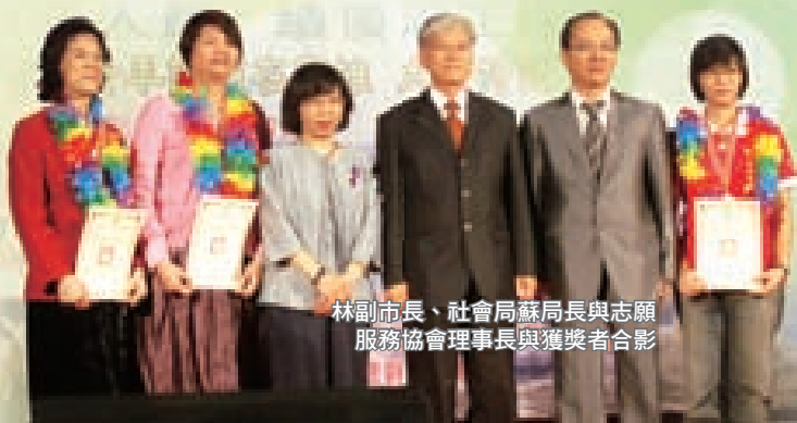
林副市長、社會局蘇局長與志願服務協會理事長與獲獎者合影

2009年是高雄市在國際舞臺發光發熱的一年，也是推展志願服務成果豐收的一年，已經成功圓滿落幕的世界運動會，以及國際志工協會第12屆亞太區域年會，皆讓高雄市在國際舞臺展現丰姿，期待更多市民能共同將力量與熱情投入志願服務，共同為營造港都志工城市努力。