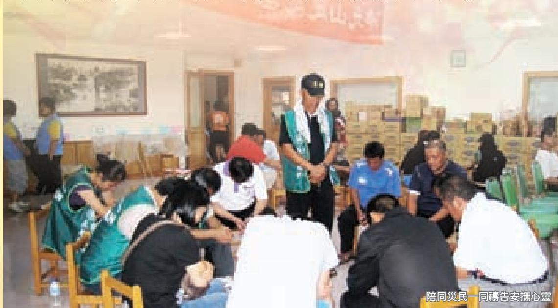
陪同災民一同禱告安撫心靈

隔日上午在主委帶領下，前往屏東內埔農工救助站探視關懷並送物資，同時與屏東的家婦中心社工聯繫瞭解狀況，並說明有無任何需要協助的事項。下午，轉往旗山醫院，因為主委評估後，發現高雄縣的災情慘重亟須協助縣府，於是在旗山醫院再與本市原民會志工同仁，共同分擔協助災民連繫工作。