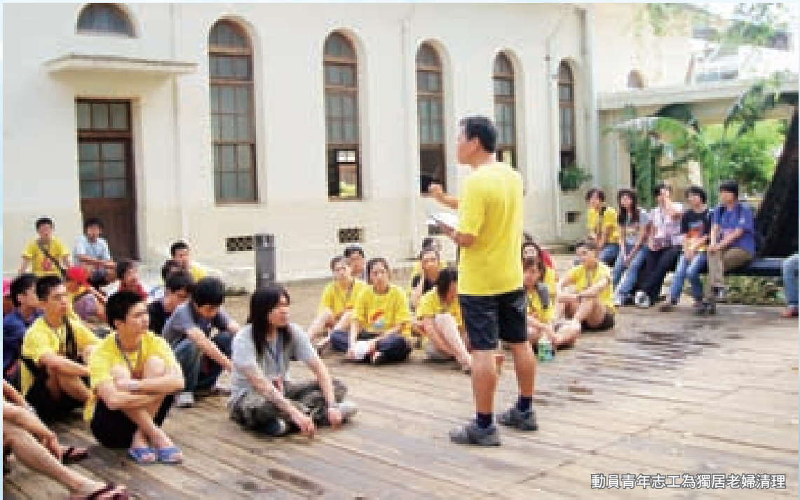
動員青年志工為獨居老婦清理