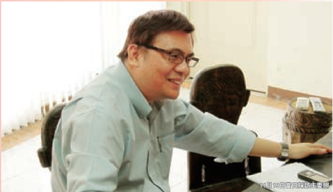
11月19日當日採訪主委照