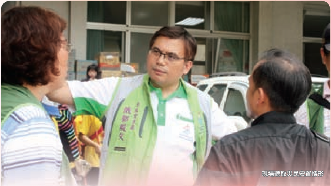
現場聽取災民安置情形

期間，原民會曾陪同陳菊市長發放慰問金3,000元，第二次則由日月之光慈善基金會同樣發放3,000元。同時，補助上述七個慈善機構每會10至20萬元不等。另有慈善團體新竹扶輪社，提供100位小朋友為期一年每人每月2,500元，令原民會感受到社會的溫暖。