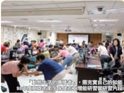
「動態生活的傳播者」，需充實自己的知能 98年度高雄市衛生保健志工增能研習營研習片段

分別從：身體組成方面〈身體質量、體脂肪、腰臀圍比、平衡感〉、肌耐力方面、柔軟度方面、心肺耐力等……，藉著各種儀器與動作，由這群訓練、測試合格的專業志工，溫馨且耐心的為市民服務；平日他們定期前往各社區協會、里鄰衛生所，擔任種子師資為另一群的志工示範教學，擴散更大的服務層面；有時又來到各企