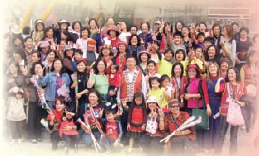
活動志工推動大小活動

二、服務範圍 依型態分為「行政志工」：包括民眾申請表件解說(母語講解)、表格填寫及送件，內容分別是協助辦理原住民學生獎助學金、幼稚教育補助、國中小營養午餐補助、急難救助及醫療補助、職業教育訓練補助、技術士證照獎勵金、求職登記申請、家暴暨性侵通報與防治、中低收入福利措施、住宅及經濟事業貸款、法律諮詢；「活動志工」：辦理活動時人員引導及諮詢，每年度協助大型活動，如95年南島文化博覽活動、96年10週年紀念晚會活動、97年婦女節活動及母親節活動、98年原住民聯合豐年祭，另有不定期個案探訪及送書服務。