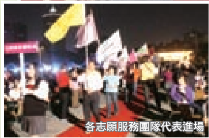
各志願服務團隊代表進場

本次活動除了以博覽會的方式展現高雄市推展志願服務的卓越績效外，現場更設有代表南台灣特有飲食、工藝文化的民俗展，以及由右昌國小右馨志工團及三奇美髮型美容連鎖公司穿插演出精采的舞蹈及彩妝秀，讓本次的慶祝活動有如志願服務的嘉年華會，場面熱鬧非凡，充份展現出南台灣志工的熱情。