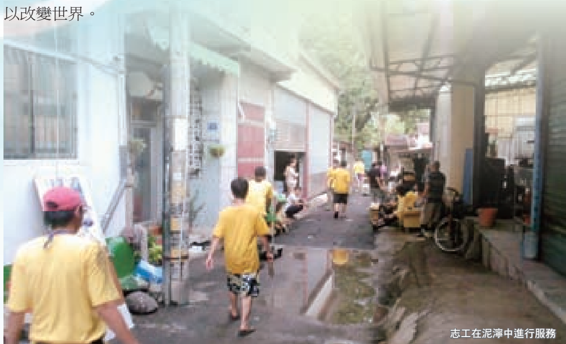
志工在泥濘中進行服務

傍晚全身泥濘又溼答答的志工隊回到文化園區，園區內只有冷水可以洗澡，於是大男生們很克難地在後方長廊上一字排開用水管洗戰鬥澡，一行人來自全過各地，有教官、老師、大學生、更有上班族特別請假南下加入當救災志工，也有媽媽感謝地說有這機會才能和女兒一起當志工，做有意義的事。台灣人就是這麼良善可愛，吃不好、睡不好卻甘願的做，這批隊伍更獲行政院青輔會王主委南下關心鼓勵，在服務過程中志工們成長自己也成就別人，因為我們堅信青年可以改變世界。